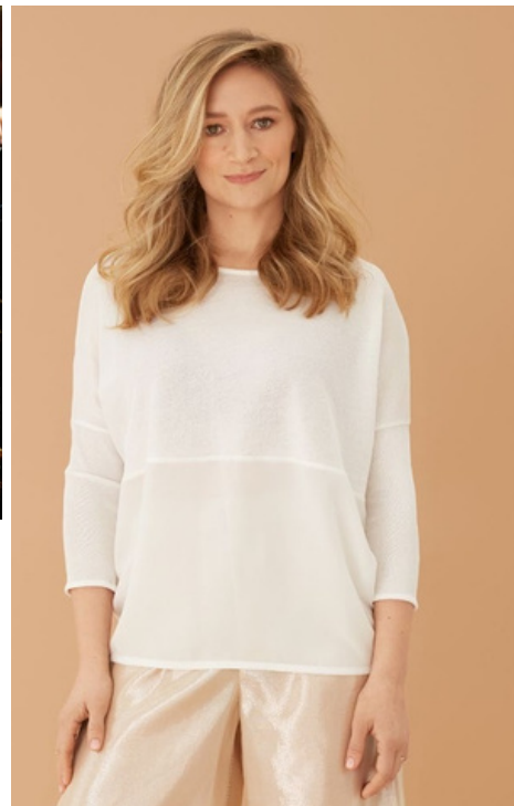
Orchestre des Pays de Savoie - Yefim Bronfman - Sabine Devieille