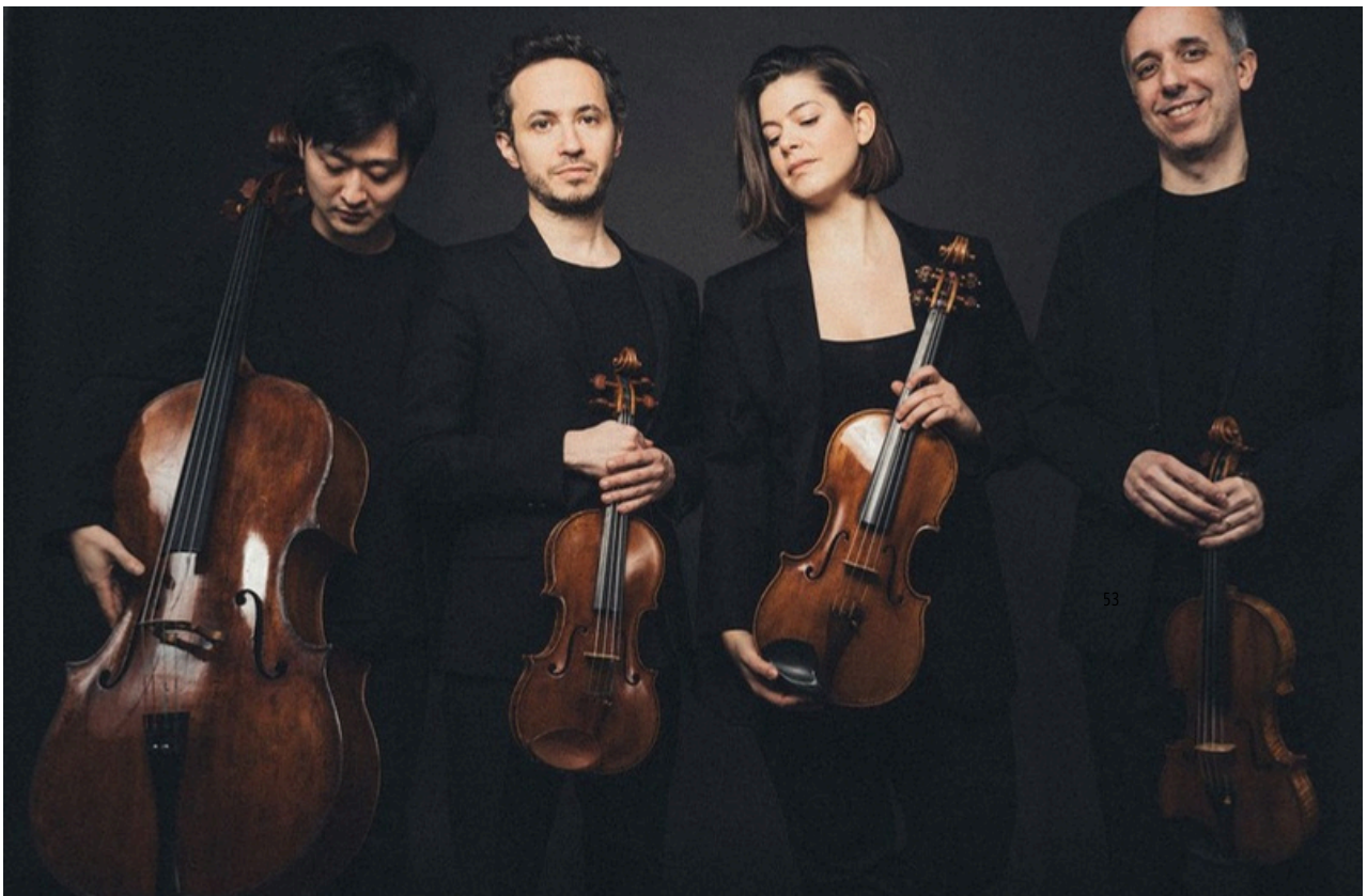
Éric Ruf – Benjamin Bernheim - Quatuor Ébène