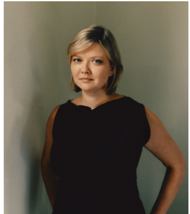
Raphaël Pichon - Arielle Beck - Eva Ollikainen - Alina Ibragimova