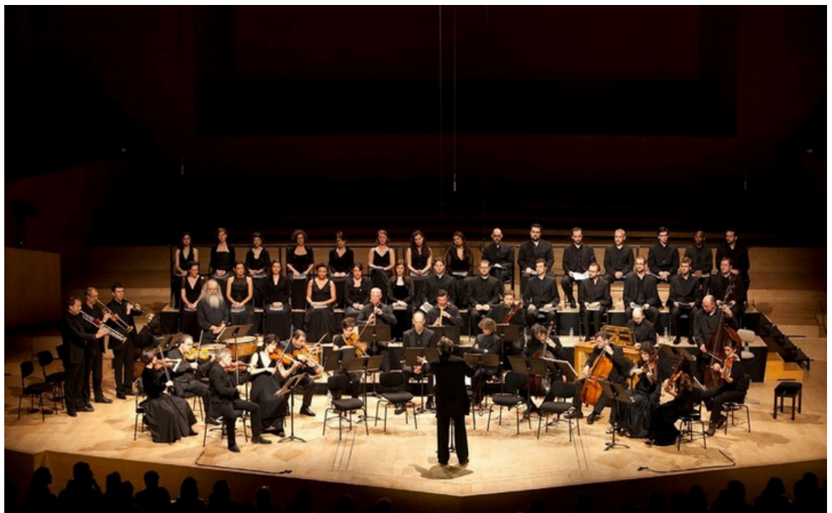
Véronique Gens - Jordi Savall - Concert des nations