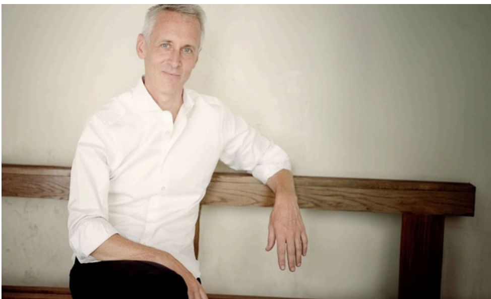
Grigory Sokolov - Sébastien Daucé