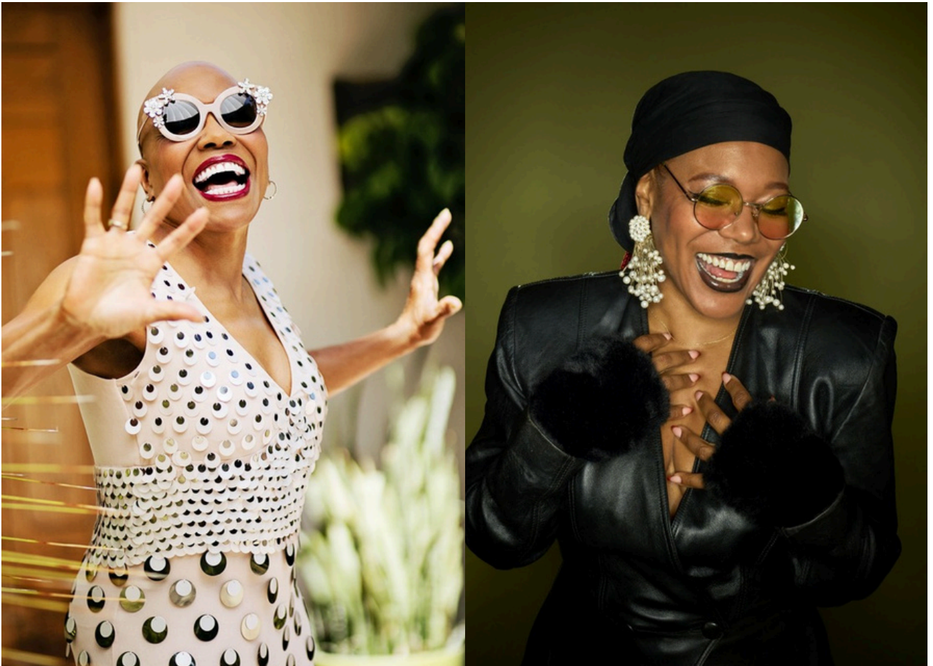
Dee Dee Bridgewater - China Moses