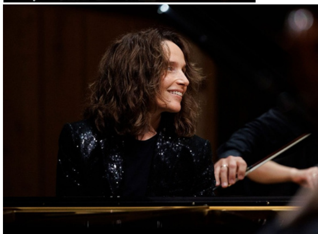
Ivan Fischer - Martha Argerich - Arcadi Volodos - Hélène Grimaud